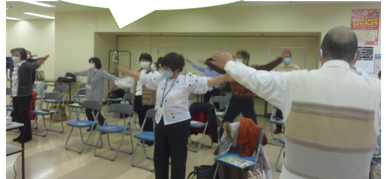
健康増進学科であさいちばんの恒例の「三河弁ラジオ体操」・・・今日も一日がんばるまい